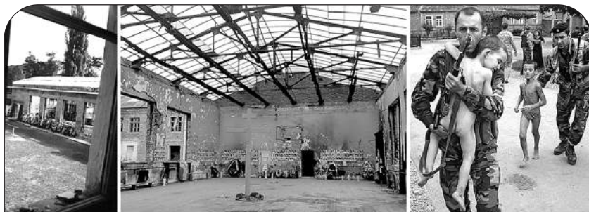
Из этого окна пулемет террористов поливал свинцом детей, разбежавшихся после взрыва в спортзале.

Но именно это и нужно было террористам: чем больше ужаса, тем легче добиться своего. Они знали, что за стенами школы мечутся обезумевшие от горя родственники заложников. Они видели из окон, что отцы захваченных детей рвутся к оружию. Все это воздействовало на власти, заставляло их лихорадочно искать выход из ситуации. Ведь власти понимали, что они не должны принимать условия террористов. Но еще лучше они понимали, что не имеют права допустить гибели заложников!